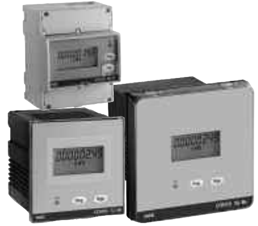
Cod. CE4ST - CE72S - CE96S